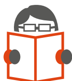
Обучающие программы для менеджмента компаний