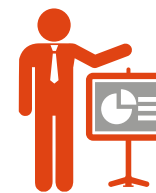
Компетентный информационный ресурс