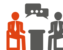
Серия встреч Сети – Производитель