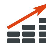
Актуальная аналитика рынка