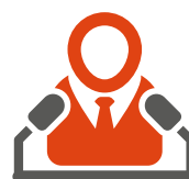
Серия мероприятий, ориентированны на все уровни менеджмента компании